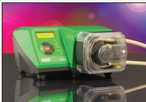
▲ Watson-Marlow 520 Pumpe